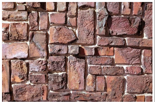
Gereformeerde Kerk in Andijk am IJsselmeer (Westfriesland), erbaut 1928, Architekt: Egbert Reitsma

Mit sichtbarem Stolz erzählte er von der Geschichte der Kirche, von den Details der geplanten Wiederherstellungsmaßnahmen - und was sich der Architekt damals beim Entwurf gedacht hatte. Für die Kirchenwände – innen und außen – hat er bewusst handbearbeitete Ziegelsteine verwendet, schief und krumm, glatt, uneben, rau und zerfurcht, teilweise verfärbt und verbrannt . Der Architekt verglich die Ziegelsteine mit den Menschen, aus denen die lebendige Kirche gebaut ist. Die sind auch nicht perfekt und glatt wie industriell hergestellte, ISO-genormte Einheitsziegel, sondern ebenso einzigartig wie diese schönen, lebendigen Mauersteine. In seinem Gebäude findet jeder Stein seinen Platz. Ein schönes Bild! Ich finde, es passt auch zur Gemeindefarbeit. Jedes Mitglied unserer Kirche kann Bestandteil der Gemeinschaft sein. Jeder kann tragender Bestandteil des Gebäudes sein, auch wenn er sich „schief „ und „krumm“ fühlt. Wir müssen uns nur bemühen, jedem den Raum zu geben, der zu ihm passt. Das Fundament hat Jesus gelegt. Es kann alle tragen.